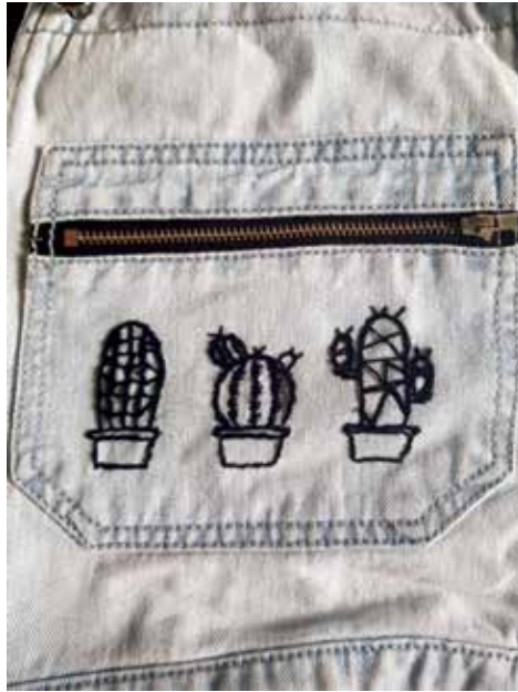
Imagen 10. Ejercicio realizado por Gia Espinoza