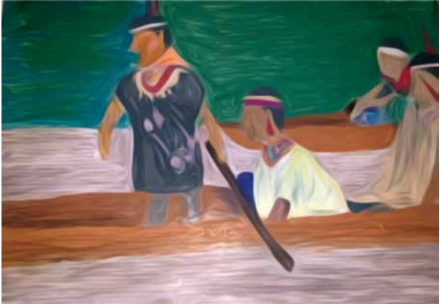
Imagen 4. Ejercicio realizado por Daniela Mera a partir de Documental Gartelmann la Memoria (Álvarez, 2019)