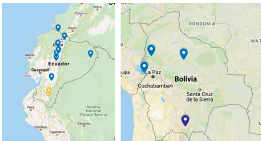
Imágenes 15 y 16. Registro de los puntos diálogos realizados por los estudiantes sobre artes populares en Bolivia y Ecuador

Una de las metodologías planteadas para pensar en la diversidad cultural de nuestras regiones y los diálogos sur-sur fue realizada por medio de la plataforma google maps . La consigna fue que se identifique en el mapa un lugar preciso de Bolivia o Ecuador y realice una intervención grupal sobre la producción artística indígena o popular de esa zona. Luego de insertar la información en el mapa, la propuesta fue realizar una lectura libre de carácter poética sobre las estéticas previamente seleccionadas.