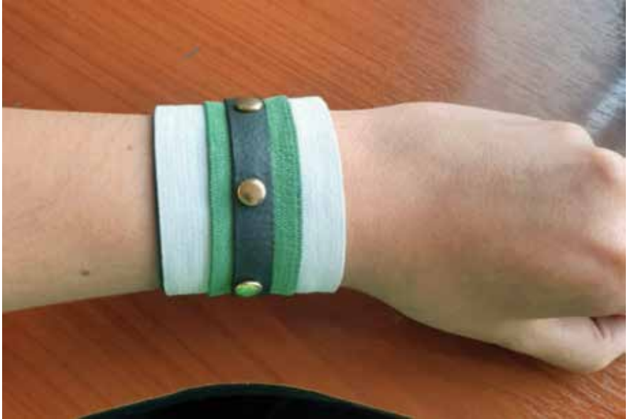
Imagen 12. Ejercicio realizado por Pedro Castillo