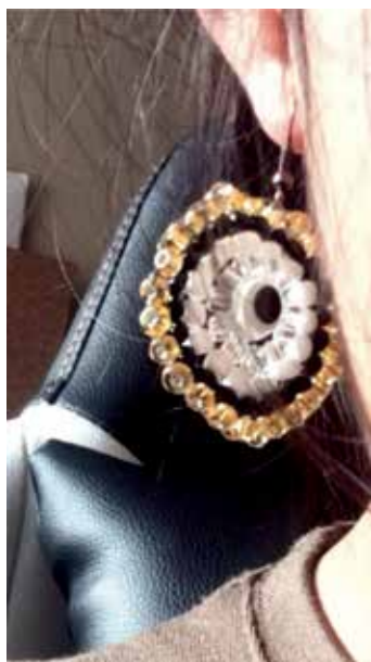
Imágenes 8 y 9. Ejercicio realizado por Ana Paula Buñay