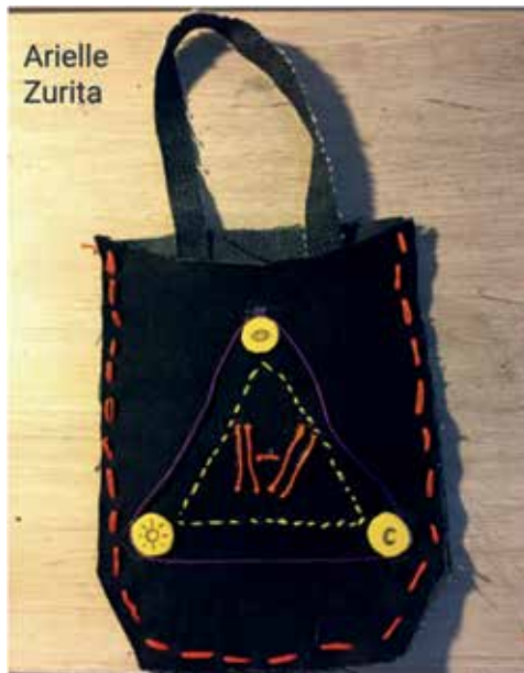
Imagen 11. Ejercicio realizado por Arielle Zurita