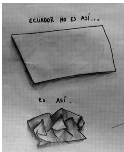
Imagen 1. Ejercicio realizado por Rafael Guerra Villacrés a partir de documental sobre Rolf Blomberg (Barriga y Ortega, 2014)

Mostramos una selección de los resultados de este ejercicio a continuación. Es importante aclarar que estos productos eran pensados como ejercicios prácticos y no tenían la finalidad de ser exhibidos, publicados o ser considerados como productos artísticos: